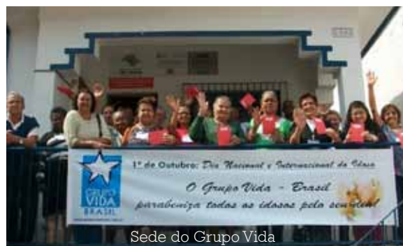
Sede do Grupo Vida