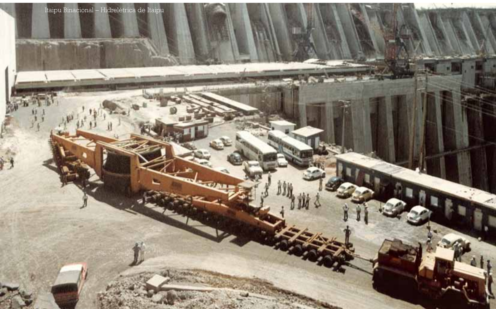
Itaipu Binacional – Hidrelétrica de Itaipu

“ ATRAVÉS DA PERSEVERANÇA, MEU PAI TRANSFORMOU A IRGA NO QUE É HOJE, LÍDER EM TRANSPORTE RODOVIÁRIO DE CARGAS SUPERPESADAS E SUPERDIMENSIONADAS DA AMÉRICA LATINA.