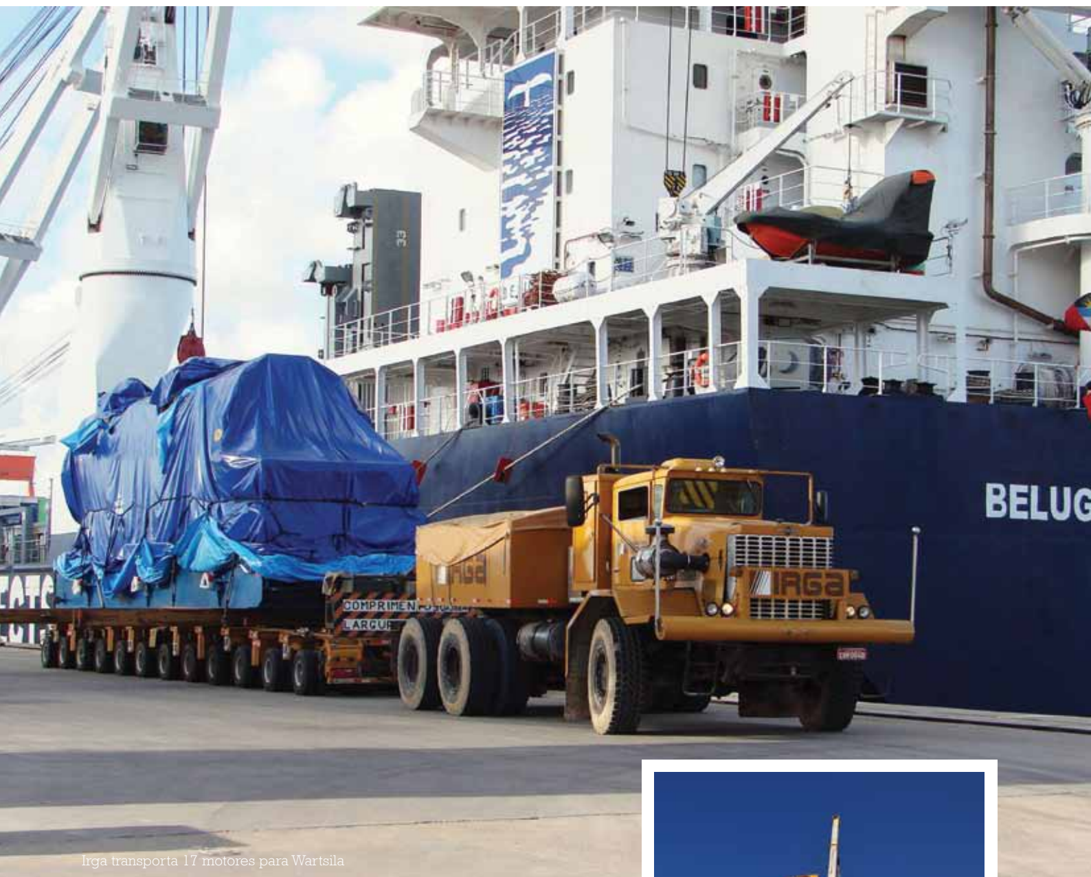
Irge transporta 17 motores para Wartsila

A Irge iniciou 2011 com grandes projetos, não apenas em transportes de cargas superdimensionadas como em guindastes. A necessidade de se estabelecer uma forte infraestrutura para a realização das operações, fez com que alguns desses projetos tivessem início no ano passado, para serem finalizados neste ano. Os numerosos e importantes transportes, dos quais a Irge tem participado, mostra o compromisso que a empresa tem com o mercado, reafirmando seu profissionalismo e seriedade no segmento em que atua. Confira ao lado alguns desses projetos.