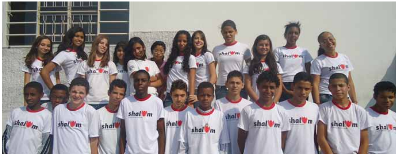
Alunos do projeto Shalom