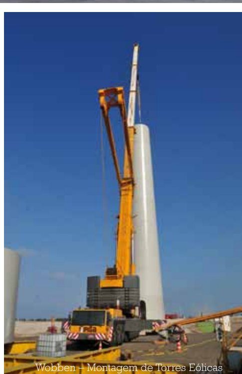
Wobben – Montagem de Torres Eólicas

A Irge iniciou 2011 com grandes projetos, não apenas em transportes de cargas superdimensionadas como em guindastes. A necessidade de se estabelecer uma forte infraestrutura para a realização das operações, fez com que alguns desses projetos tivessem início no ano passado, para serem finalizados neste ano. Os numerosos e importantes transportes, dos quais a Irge tem participado, mostra o compromisso que a empresa tem com o mercado, reafirmando seu profissionalismo e seriedade no segmento em que atua. Confira ao lado alguns desses projetos.